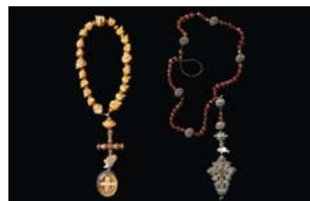
Zwei der rund 400 ab Ende März im Gemeindemuseum ausgestellten Rosenkränze.

Führungen durch die Ausstellung jeweils am Freitag um 20 Uhr, am Samstag und Sonntag um 17 Uhr und nach Vereinbarung (0676 / 84 05 32 700).