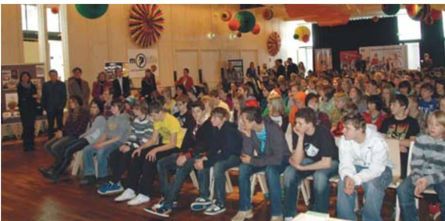
Zahlreiche Schülerinnen und Schüler aus Absam, Hall, Rum und Mils kamen zum ersten JOB Info-Tag nach Absam.

grieren. Als Hilfeleistung hat nun die Gemeinde Absam im Rahmen der Mobilen Jugendarbeit Innsbruck Land Ost einen Jobcoach installiert. Den Auftakt dazu bildete am 25. Februar der JOB Info-Tag im KiWi, wo zahlreiche Institutionen, wie das AMS, die VIA Produktionsschule, BOAT Berufsorientierung und Ambulantes Arbeitstraining Wattens, ARBAS Arbeitsassistenten Tirol, die Polytechnische Schule Hall sowie die in Absam angesiedelten Fachberufsschulen interessierten Schülern und Jugendlichen Informationen aus erster Hand boten.