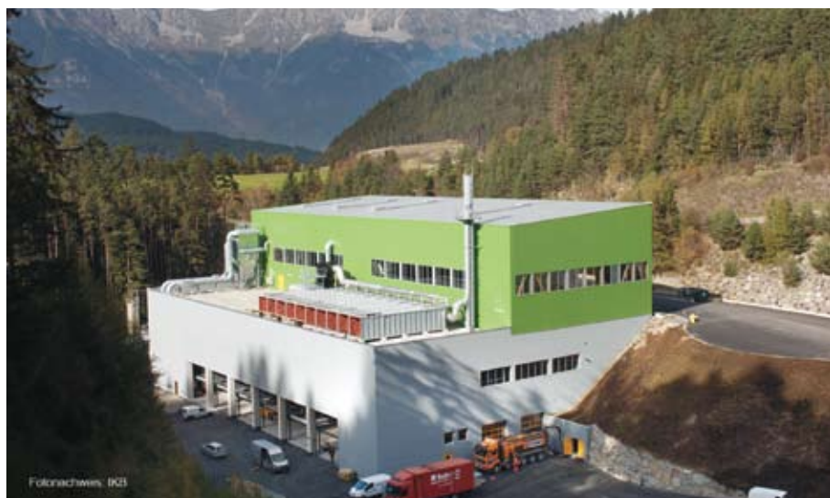
Die mechanische Abfallsortieranlage Ahrental ist seit 3. Jänner 2011 in Betrieb. Ab Mai können sich Interessierte selbst ein Bild von der unabhängigen Tiroler Abfallbehandlung machen.

Seit 3. Jänner dieses Jahres ist die mechanische Abfallsortieranlage Ahrental (MA Ahrental) in Betrieb. Das bedeutet eine eigenständige und unabhängige Abfallentsorgung für den Zentralraum Tirol (Innsbruck-Stadt, Bezirke Innsbruck-Land und Schwaz). Die MA Ahrental ist eine Kooperation von ATM-Abfallwirtschaft Tirol Mitte (Bezirke Innsbruck-Land und Schwaz) und den IKB-Innsbrucker Kommunalbetrieben (Innsbruck-Stadt).