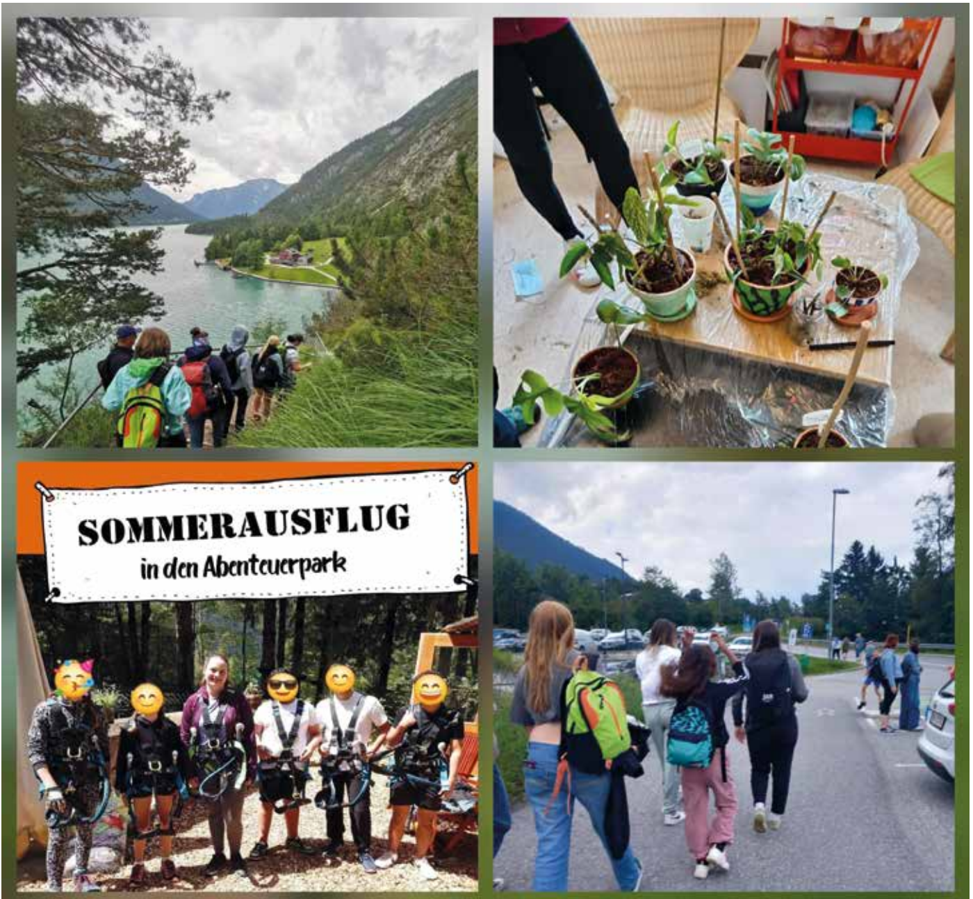
Vielseitige Ausflüge für Jugendliche konnten in den Ferien mit JAM umgesetzt werden.

Bei all diesen Aktionen spielt die Gemeinschaft ebenfalls eine wesentliche Rolle. Es bietet sich die Gelegenheit, neue Freundschaften zu schließen, Gruppengespräche zu aktuellen Themen zu führen und eine lustige und unterhaltsame Zeit mit anderen Jugendlichen zu verbringen.