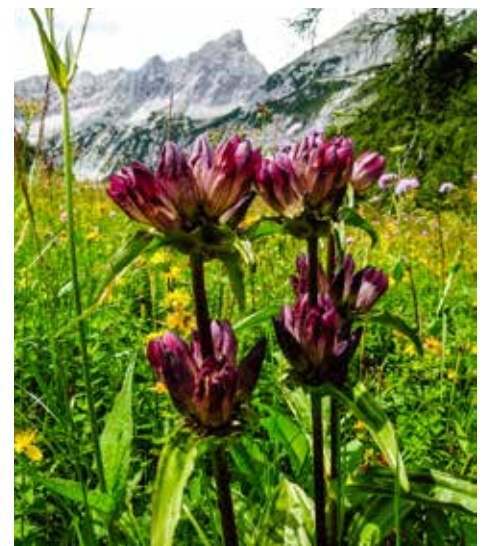
Der Pannonische Enzian blüht in seiner ganzen Pracht am Issanger

ein Hinweis auf die besondere ökologi- sche Bedeutung der Wiese.