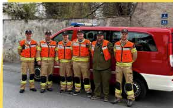
Verkehrsregelung Erstkommunion, 12.04.2026