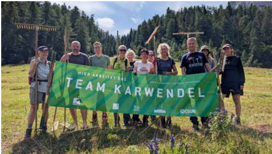
Freiwillige des TEAM KARWENDEL bei der Biotoppflege am Issanger

Entlang schattiger Felswände, die sich zu einer Schlucht verengen, führt der Hirschbadsteig vom hinteren Halltal durch den Wald hinauf ins Isstal. Schritt für Schritt wird es ruhiger, bis sich plötzlich die weite, bunte Bergwiese des Issangers vor einem ausbreitet.