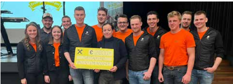
Die Jungbauern des Erntebezirks überreichen der Vinzenzgemeinschaft Absam einen Spendenscheck über 2.000 Euro.

Das Erntebezirksfest der Jungbauern stand heuer nicht nur im Zeichen von Tradition und Gemeinschaft, sondern brachte auch einen wertvollen sozialen Beitrag.