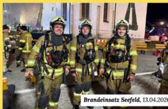
Brandeinsatz Seefeld, 13.04.2026