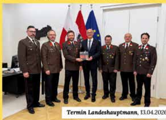
Termin Landeshauptmann, 13.04.2026