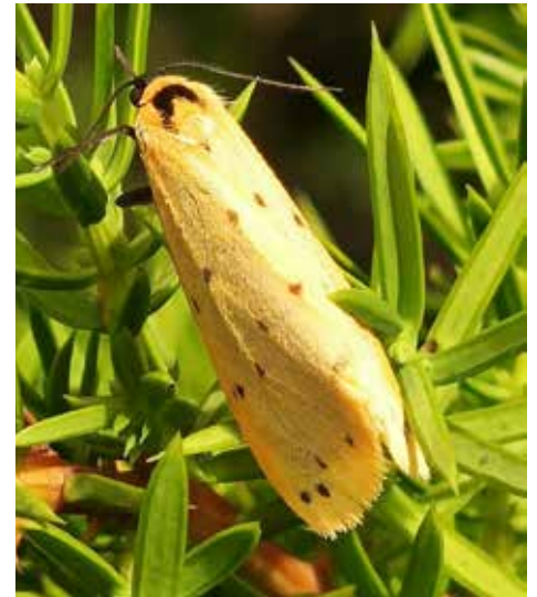
Der Trockenrasen Flechtenbär mit seinen hübschen, gepunkteten Flügeln

Diese stabile Pflanzenwelt bildet die Grundlage für eine ebenso beeindruckende Tierwelt. Besonders auffällig ist die Vielfalt der Insekten: 2025 wurden im Rahmen einer Forschungskoope- ration mit dem Landesmuseum 76 Nacht- falterarten nachgewiesen. Viele sind auf strukturreiche Wiesen angewiesen. So nutzt die Kleine Heidekrauteule Heidepflanzen als Nahrungsgrundlage für ihre Raupen und der Trockenrasen- Flechtenbär fällt mit seinen leuchtend gelben, schwarz gepunkteten Flügeln sofort ins Auge. Beim ÖEG-Insekten- camp 2024 entdeckten Forscher*innen am Issanger unter anderem die gefähr- dete Zweizähnlige Raubwanze –